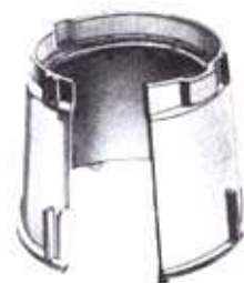
10" VB - 910