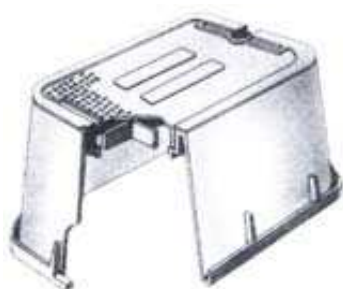
JUMBO VB - 1220