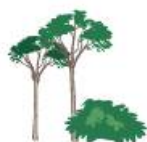
Mladé stromy a velké keře nebo křoviny