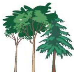
Vysoké a mladé stromy