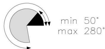
JUNIOR - 1/2", kruhové provedení, jedna tryska